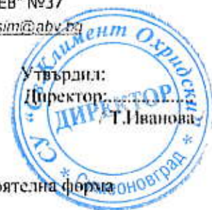
ГРАФИК за провеждане на февруарска /редовна/ сесия с ученици самостоятелна форма на обучение за учебната 2018/2019 г.

СРЕДНО УЧИЛИЩЕ "СВЕТИ КЛИМЕНТ ОХРИДСКИ" ГР. СИМЕОНОВГРАД, УЛ. "ХРИСТО БОТЕВ" №37 тел.: Директор 03781/2041; e-mail: sou_sim@abv.bg